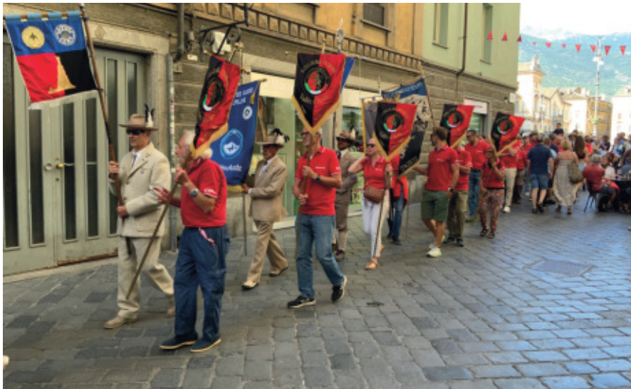
Servizio alle pagine 2 e 3