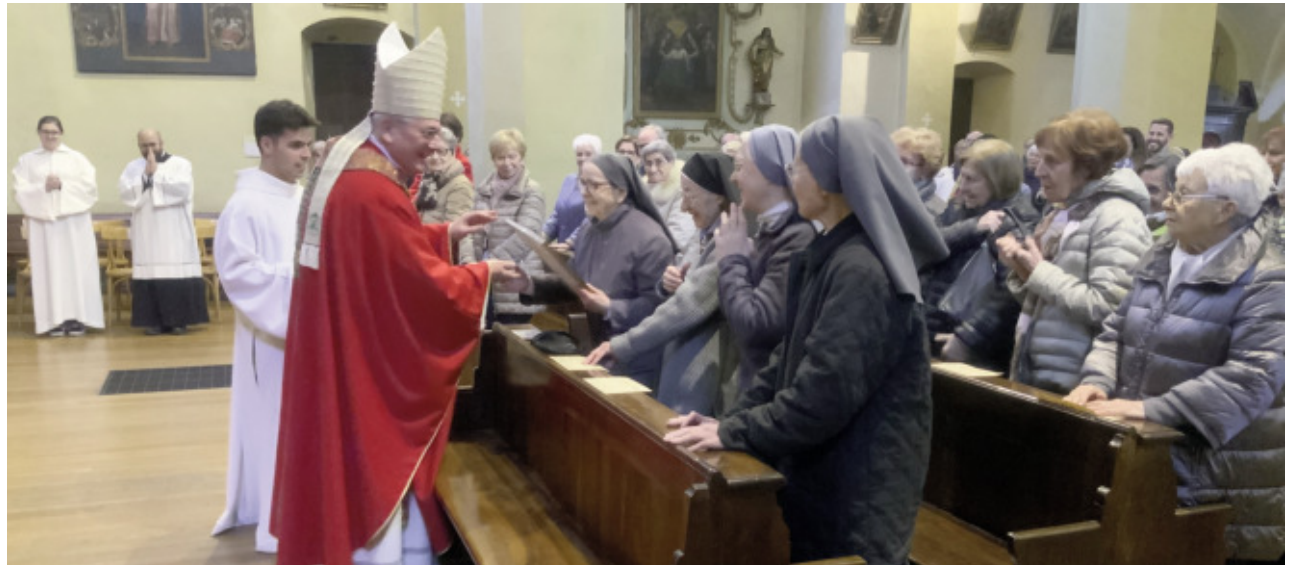
Servizio a pagina 3

«Grazie per il vostro servizio prezioso»